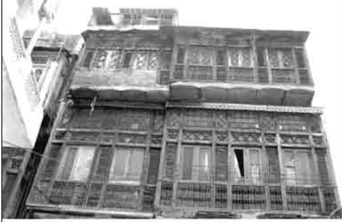
मम्मांचे जन्मस्थान - अमृतसर

...लाईट हाऊस (१९३६) ते माईट हाऊस (१९६५)... मातेश्वरी जगदंबा-सचित्र जीवनपट...!