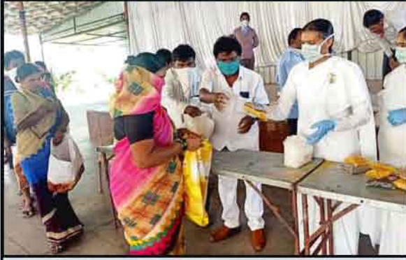
रहाटणी (पुणे) - गरजूंना संस्थेद्वारे अन्नधान्य वाटप करताना ब्रह्माकुमारी बहीण.