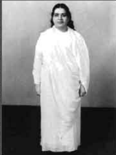
" कर्मातीत अवस्था " (नॉर्ट हाऊस)