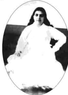
" मैं आत्मा परमधामनिवासी हूँ " ( लाईट हाऊस )

यज्ञ इतिहासातील एक सुवर्ण क्षण - बाबांनी सर्व संपत्तीचा ट्रस्ट बनवून कार्यभार मम्मांकडे सोपवला.