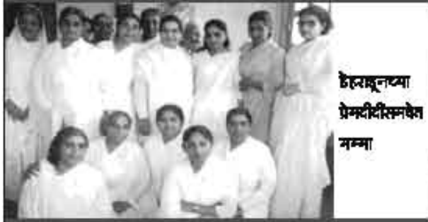
हेतरावूनच्या प्रेमदीदीसमवेत मम्मा