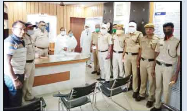
तुमसर (भंडारा) - कोरोना महामारीच्या सेवेत उपस्थित असलेल्या पोलीस कर्मचाऱ्यांचे सेवाकेंद्राद्वारे सन्मान केल्यानंतर ग्रुप फोटोत ब्र. कु. शक्ति, ब्र. कु. दिव्यता व पोलीस स्टाफ.