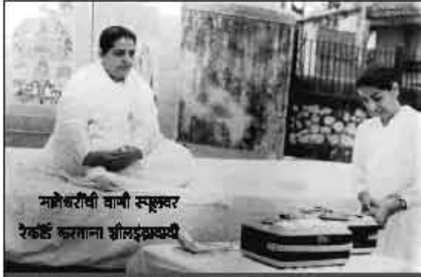
मातेश्वरीची बायीं स्पृश्वर रेकॉर्ड करताना शीलद्रव्यवती

...सॉर्ट हाऊस (१९३६) से नॉर्ट हाऊस (१९६५)... मातेश्वरी जगन्ना-सचिव जीवनपट...!