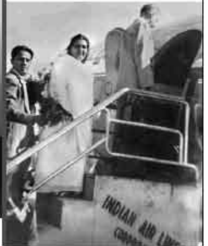
पुढील कार्यसाठी ...मातेश्वरीचे प्रयाण आणि...अत्रविदा...!