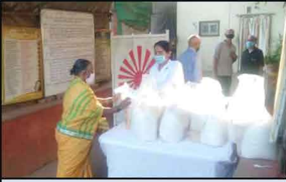
घाटकोपर - गरजूंना संस्थेद्वारे अन्नधान्य वाटप करताना ब्रह्माकुमारी बहीण.