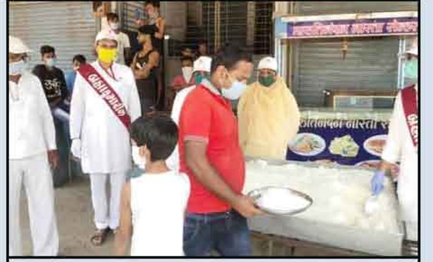
सुरत- गरजू लोकांना भोजन वितरण करताना ब्रह्माकुमारी बहीण व भाऊ.