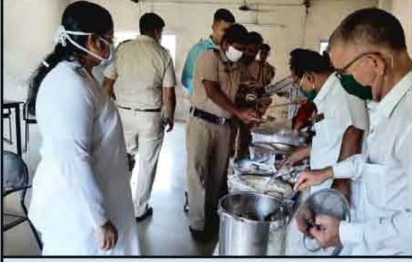
खोपोली - कोरोना महामारीच्या सेवेत उपस्थित असलेल्या पोलीस कर्मचार्यांना संस्थेद्वारे ब्रह्माभोजन करवताना ब्र. कु. मनीषा