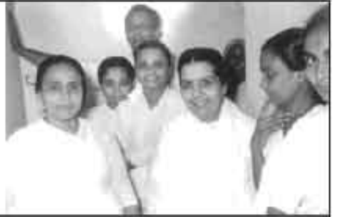
संपूर्ण मनुष्यसुडील्यो कल्पवृक्षाचे मात - पिला..